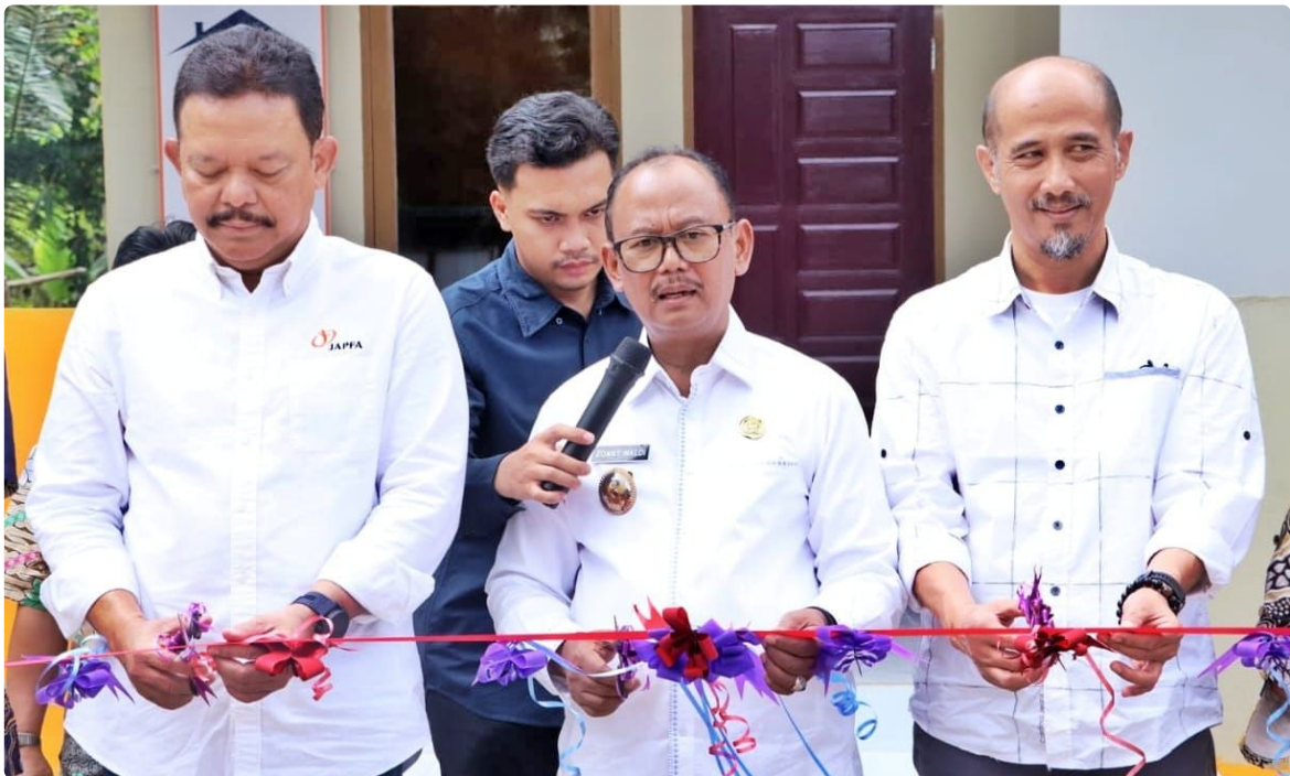
Direktur PT. Japfa Racmat Indrajaya usai meresmikan dua rumah baca mengatakan, pembangunan perpustakaan dan renovasi ini merupakan program Bakti Toba Tilapia PT Suri Tani Pemuka (STP) anak perusahaan Japfa dengan tujuan untuk menarik minat anak-anak membaca